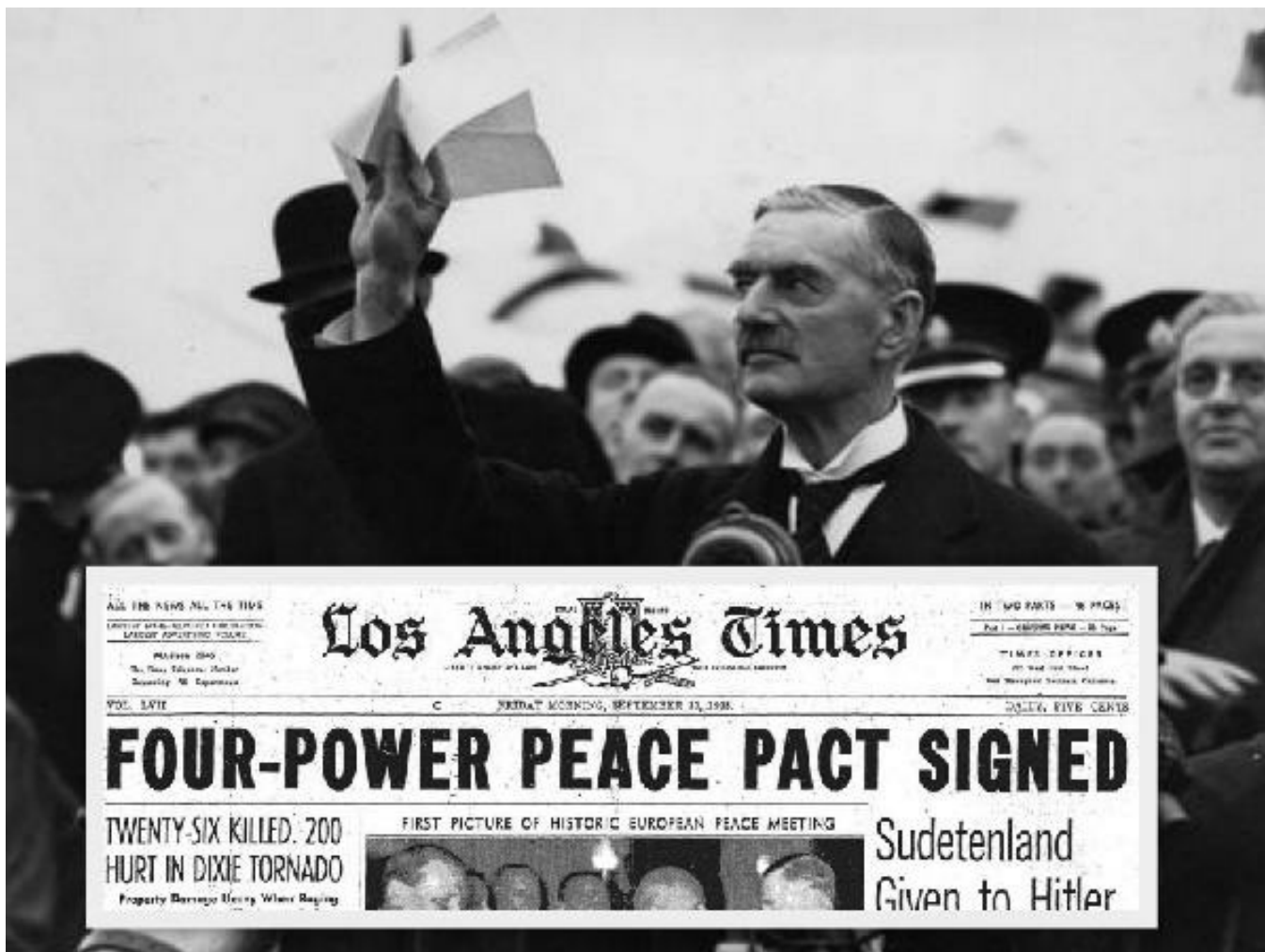
Neville Chamberlain s Mnichovskou dohodou v ruce po návratu do Londýna.

Další změny mají proběhnout v učebnicích dějepisu. Podle našeho zdroje vadí BIS hned výklad a forma několika období v meziválečném období. První výhradou jsou události okolo Mnichova v roce 1938. Podle BIS prý současné školství mluví o Mnichovské dohodě jako o »zradě«, což prý v dnešní době vyvolává nenávisť k západním zemím a proruská propaganda toho prý každoročně využívá na dezinformačních českých webech. Podle historiků prý nešlo o zradu, ale o diplomatickou dohodu, kterou česká strana podepsala. (Emil Hácha skutečně na nátlak Adolfa Hitlera nakonec dokument podepsal.)