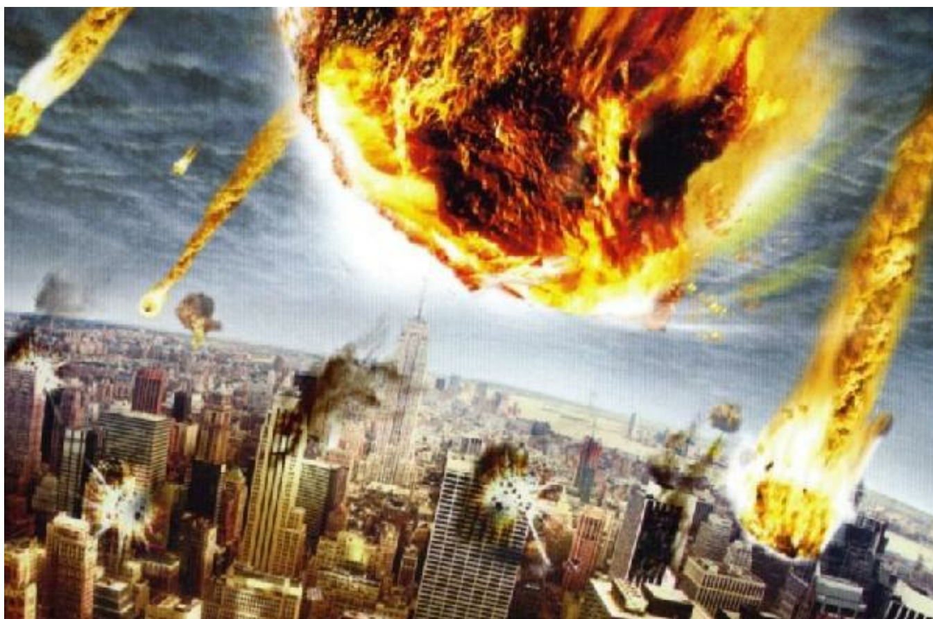
Zničení města Mekka meteoritem

Dostal džbán s vodou, ledem a několika plátky citronu. Napil se, zamlaskal a pokračoval: