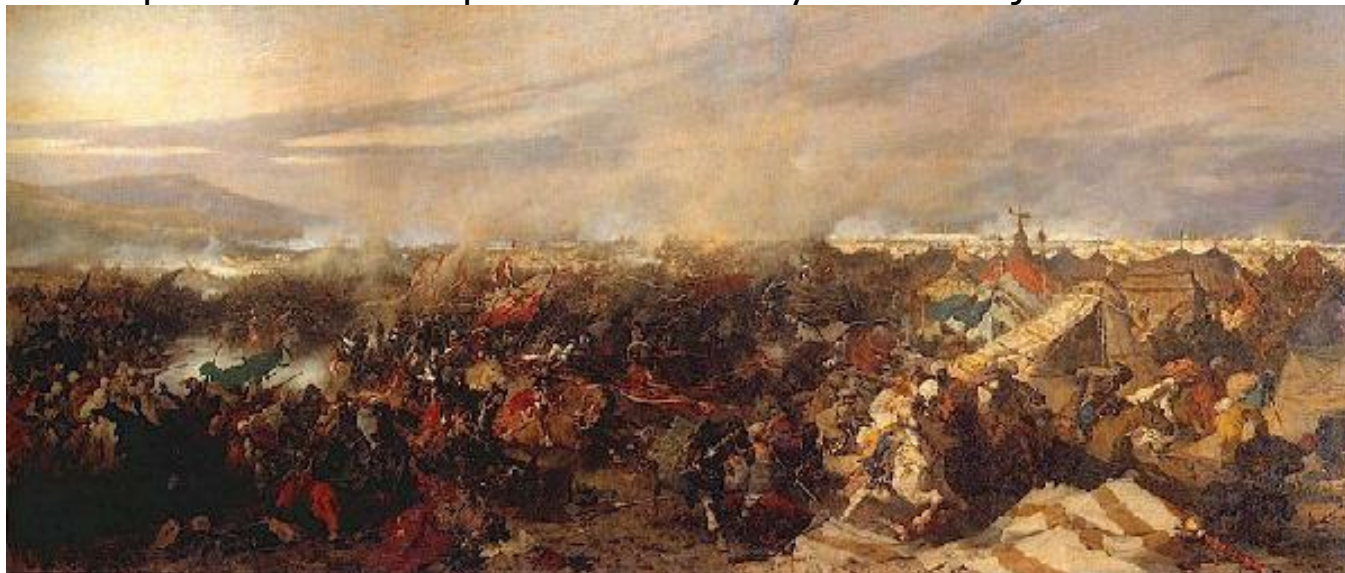
Z bitvy o Vídeň

Plácne majora do ramene, obejmě sluhu a hlasitě všem děkuje, že mohl být přítomen. Pak ho major zarazí, že tentokráte musí oni návštěvě vysvětlit, do čeho to tak vpadli. Profesor se posadí a začne s výkladem zdejší historie: