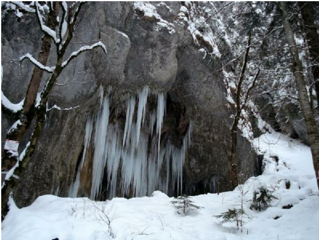
Trhlina bývá v zimě nedostupná...