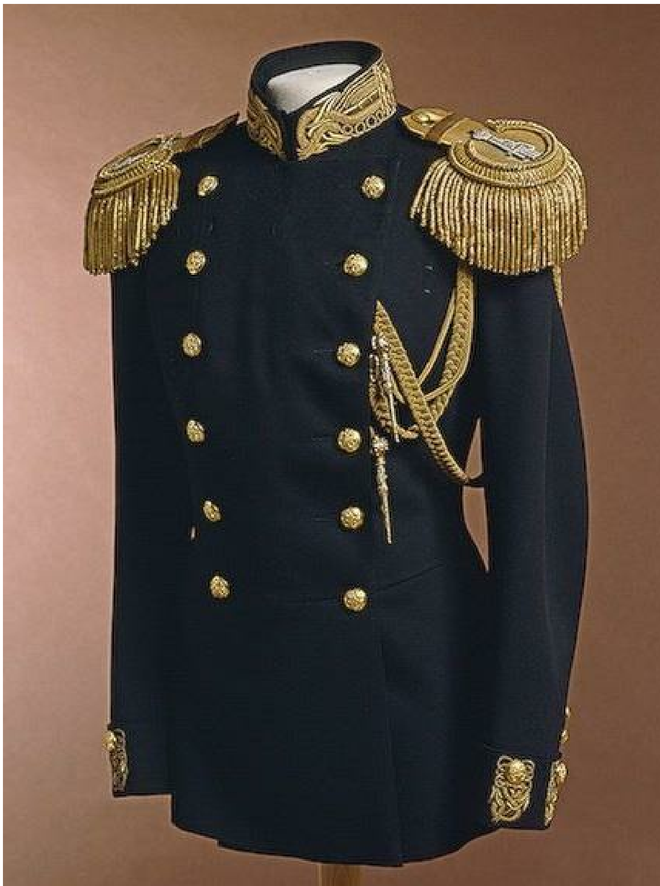
Kubův kabátec pro slavnostní chvíle

Adélka se sice po Kubovi ohlížela, když ji ty dvě odváděly k domečku Mlejnkových, ale kráčela vcelku odvevzdaně. Kuba měl sice nějaké dotazy